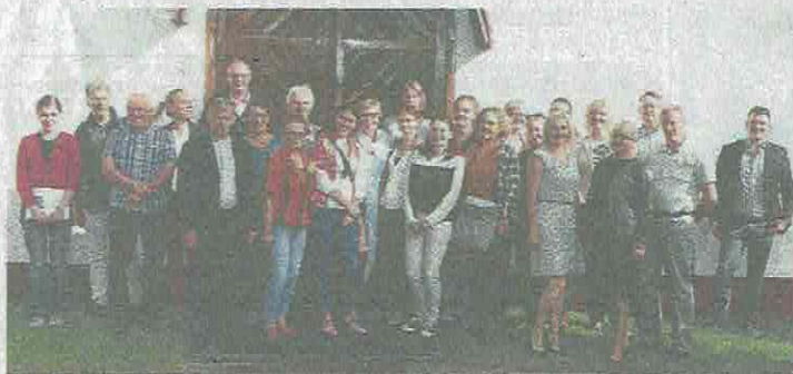
Die Gemeinde der Kirche in Klodawa Gdanska bereitete den Kieler Restauratoren einen herzlichen Empfang.

Nach der Rückkehr aus Danzig wird dort wie auch hier in Kiel an Plänen gearbeitet, die Partnerschaft zu vertiefen. Am besten soll das in Form eines Projektes geschehen, bei dem Vertreter beider Seiten ganz praktisch eine Restaurierung vornehmen – und zwar möglichst an einem Objekt, das für beide Länder Aussagekraft hat.